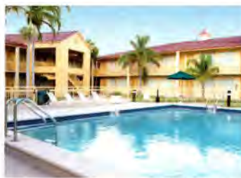
Hotel La Quinta

Hinweis: Eine Person pro Zimmer muss mindestens 21 Jahre alt sein. Check-in ab 15.00 Uhr, Check-out bis 11.00 Uhr.