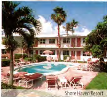
Shore Haven Resort