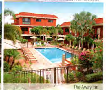
The Away Inn